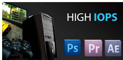
Démarrages plus rapides et multitâche sans ralentissement

La nouvelle génération de SSD Transcend SATA III 6Gb/s offre des performances supérieures ainsi qu'une fiabilité remarquable à tous les ordinateurs fixes, portables et ultrabooks modernes. Conçus pour du multitâche efficace et sans ralentissement, ces SSD SATA III représentent la solution idéale d'amélioration des systèmes informatiques dédiés au multimédia et aux jeux vidéos.