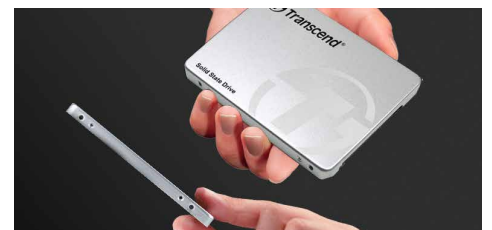
Facteur de forme ultrafin 6.8mm