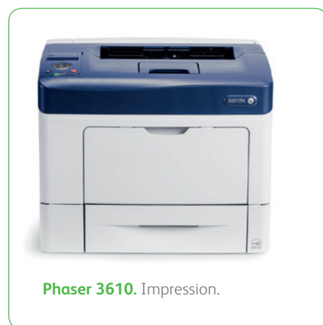
Phaser 3610. Impression.