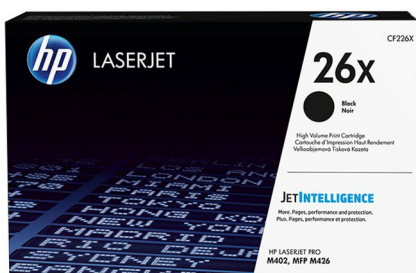
Cartouches de toner conçues par HP avec JetIntelligence

Tirez le meilleur parti de votre imprimante. Imprimez encore plus de pages de qualité professionnelle, 1 grâce aux cartouches de toner spécialement conçues par HP avec la technologie JetIntelligence. Bénéficiez de meilleures performances, d'une efficacité énergétique supérieure et de la qualité dont seul HP a le secret. 1